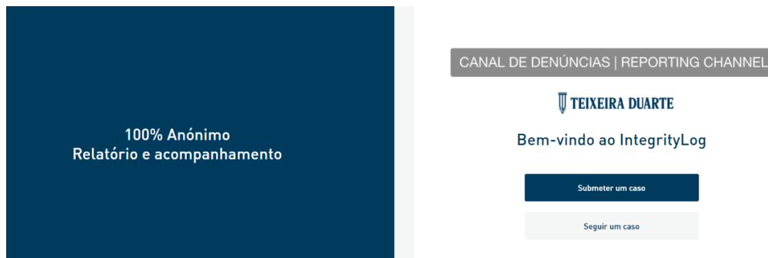
Figura 2 - Canal de Denúncias (IntegrityLog)

Nos termos e para os efeitos do disposto na Lei n.º 93/2021, de 20 de dezembro, o Canal de Ética tem como compromisso garantir a proteção dos denunciadores através da possibilidade de serem realizadas denúncias de forma anónima, a ausência de retaliação (dano patrimonial ou não patrimonial) e a garantia da conservação, integridade, confidencialidade e exaustividade das informações reportadas.