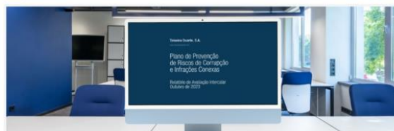
Figura 5 - Mosaico de Comunicações na Intranet

Teixeira Duarte disponibiliza o Relatório de Avaliação Intercalar do Plano de Prevenção de Riscos de Corrupção e de Infrações Conexas 4 DE NOVEMBRO 2023