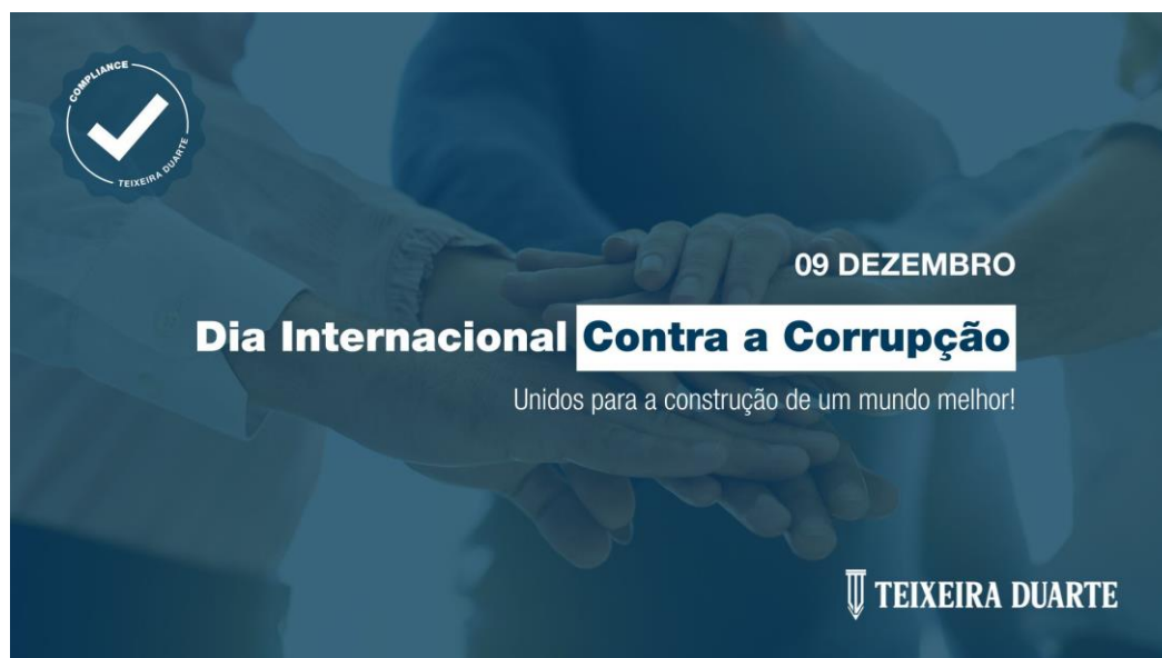
Figura 6 - Campanha Dia Internacional Contra a Corrupção

A TDSA também realizou uma campanha por ocasião do “Dia Internacional Contra a Corrupção”, que se assinala no dia 09 de dezembro, durante 27.11.2023 a 10.12.2023, que consistiu em alterar o bloqueio de ecrã do computador de todos os colaboradores dos vários países em que o GTD atua, com a seguinte comunicação: