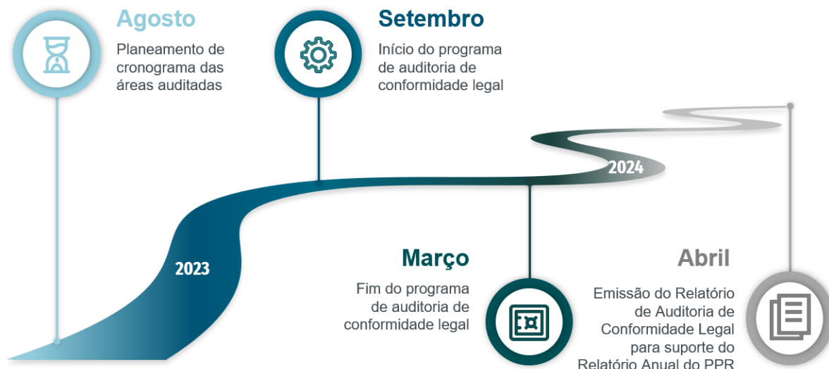
Figura 7 - Plano de Execução de Auditoria

Este programa tem como objetivo avaliar, de maneira periódica e independente, a conformidade legal dos requisitos constantes no Decreto-Lei 109-E/2021, de 9 de dezembro, sobretudo os associados ao Sistema de Controlo Interno, tendo sido implementado o seguinte plano de execução para o efeito: